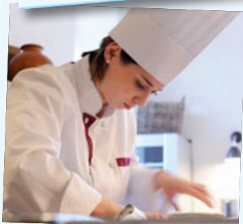
Lisa Safrana www.sofitel.com